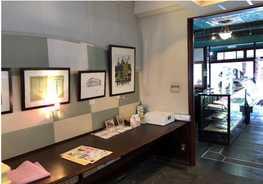
店内のギャラリー。菓匠の歴史に触れられます。