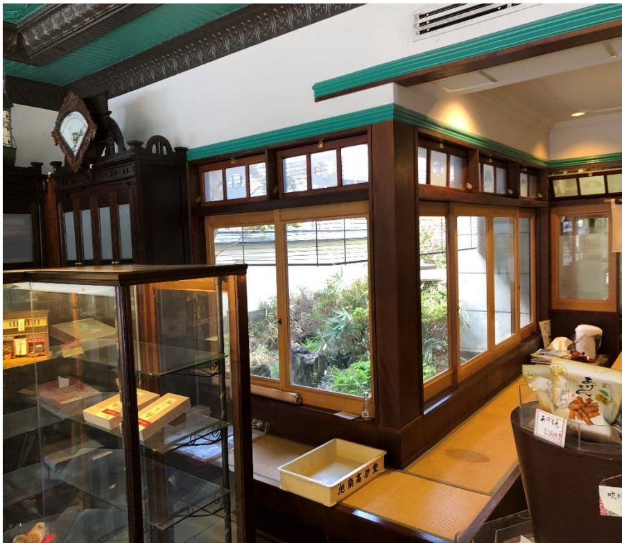
坪庭の若葉に風雅への新風が・・・。