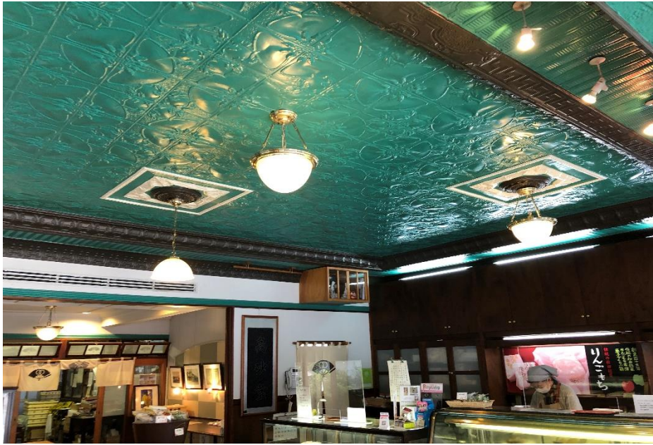
天井から降り注ぐ柔らかな紺緑の光。